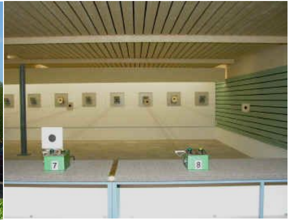
Unsere moderne 50/25/10 Meter Schiessanlage Der unterirdische 10 Meter Stand