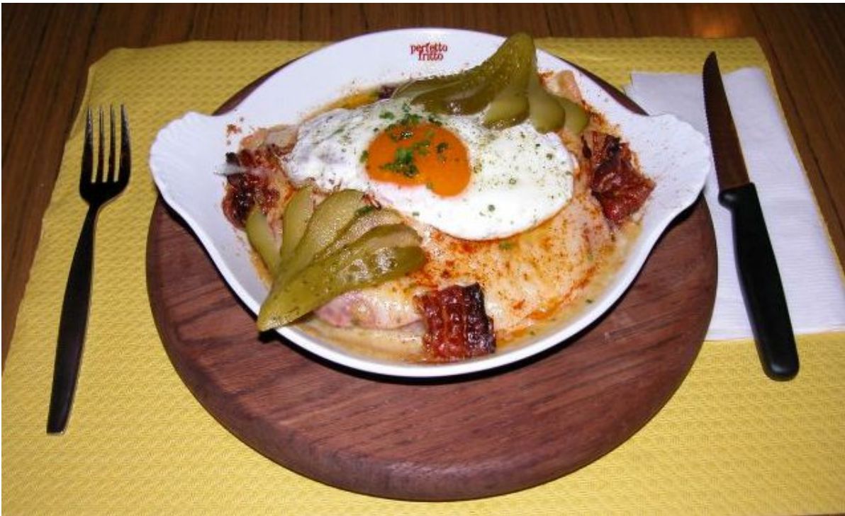
Unsere leckere Käseschnitte

Wir heissen Euch herzlich im Schützenstübli willkommen.